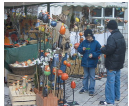
30 Keramiker am Rupertusplatz

Einzigartig ist alles, was auf dem Töpfermarkt vertreten ist, schließlich handelt es sich immer um die Handarbeit einer uralten Handwerkerzunft. Immer stehen die Handwerker - im wahrsten Sinn des Wortes - hinter ihren Produkten und freuen sich über ein Gespräch mit den Keramikliebhabern in Seekirchen.