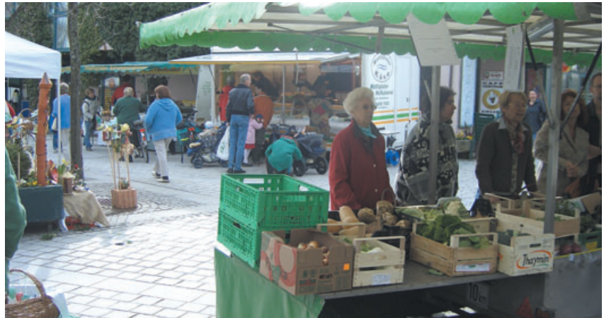
Jeden Samstag Vormittag regionale Schmankerl am Bio-Markt

bringsel sind auch die Seekirchner Geschenk-Gutscheine, sie können in rund 65 Unternehmen eingelöst werden. Erhältlich sind die Gutscheine beim Bürger- und Gästeservice im Stadtamt sowie bei Raiffeisenbank, Oberbank und Elektro Stroh- bichler.