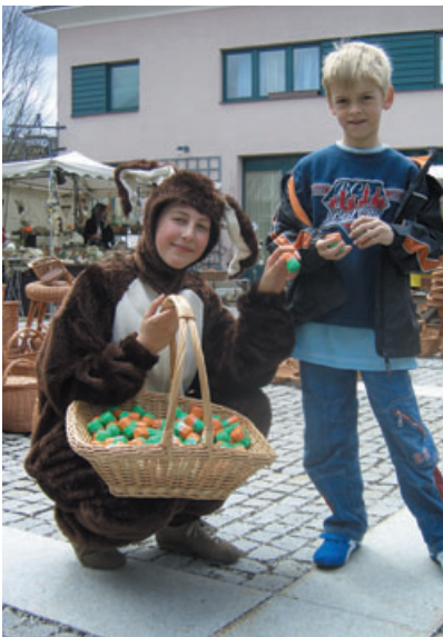
Osterhasen – Überraschungen im Stadtzentrum

Neben den Osterüberraschungen bieten die Seekirchner Geschäfte eine breite Auswahl der Frühjahrs-Modetrends genauso wie gediegene Geschenkartikel oder die aktuellen Hits der Unterhaltungsindustrie. Wer noch ein Geschenk für Ostern sucht, wird bestimmt fündig. Beliebtes Mit-