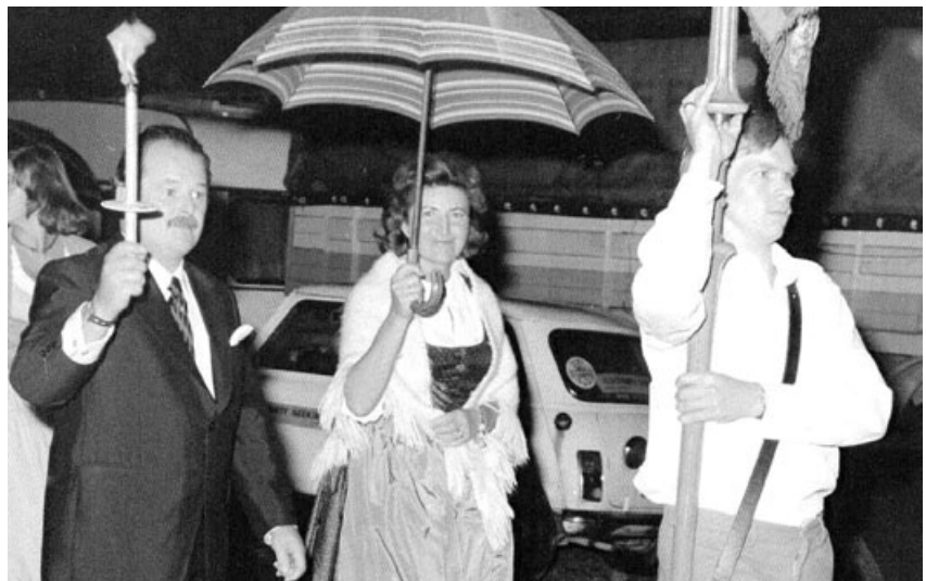
Fackelzug bei der Feier anlässlich der Zusammenlegung der Gemeinden Seekirchen-Markt und Seekirchen-Land 1974.

Die Vereinigung der Seekirchner Gemeinden zu einer Gemeinde erfolgt freiwillig und einhellig zum Wohl der Bevölkerung