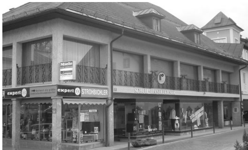
Demnächst startet der Umbau beim ehemaligen Schuhhaus Handlechner