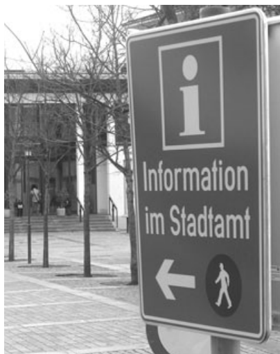
Noch besser informiert beim Bürger- und Gästeservice im Stadtamt.