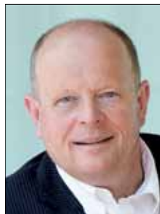
Vizebürgermeister Konrad Pieringer

Im nichtöffentlichen Teil wurde wieder einstimmig die Reihung für die 2-, 3- und 4-Zimmerwohnungen beschlossen. Mit Stand 10. Oktober 2016 haben wir bei den 2-Zimmerwohnungen 87 Bewerber, bei den 3-Zimmerwohnungen 57 Bewerber und bei den 4-Zimmerwohnungen 31 Bewerber. Die Reihung erfolgt hier nach den „Wohnungsvergabeberichtlinien der Stadtgemeinde Seekirchen“ nach dem