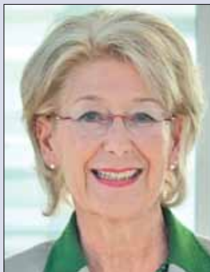
Bürgermeisterin Mag. Monika Schwaiger

Das bedeutet den Einsatz von 110(!) Personen, davon 19 MitarbeiterInnen des Stadtamtes am Wahlsonntag. Über 80 BeisitzerInnen und Vertrauenspersonen werden von den politischen Parteien genannt. Es handelt sich hier also um BürgerInnen, die quasi ehrenamtlich (gegen eine geringe Entschädigung) heuer schon viele Sonntage für diese wichtige demokratische Aufgabe zur Verfügung gestanden sind und auch in Zukunft bereit sind, ihre kostbare Freizeit zu opfern. Dafür gebührt ihnen allen große Anerkennung und Dank!