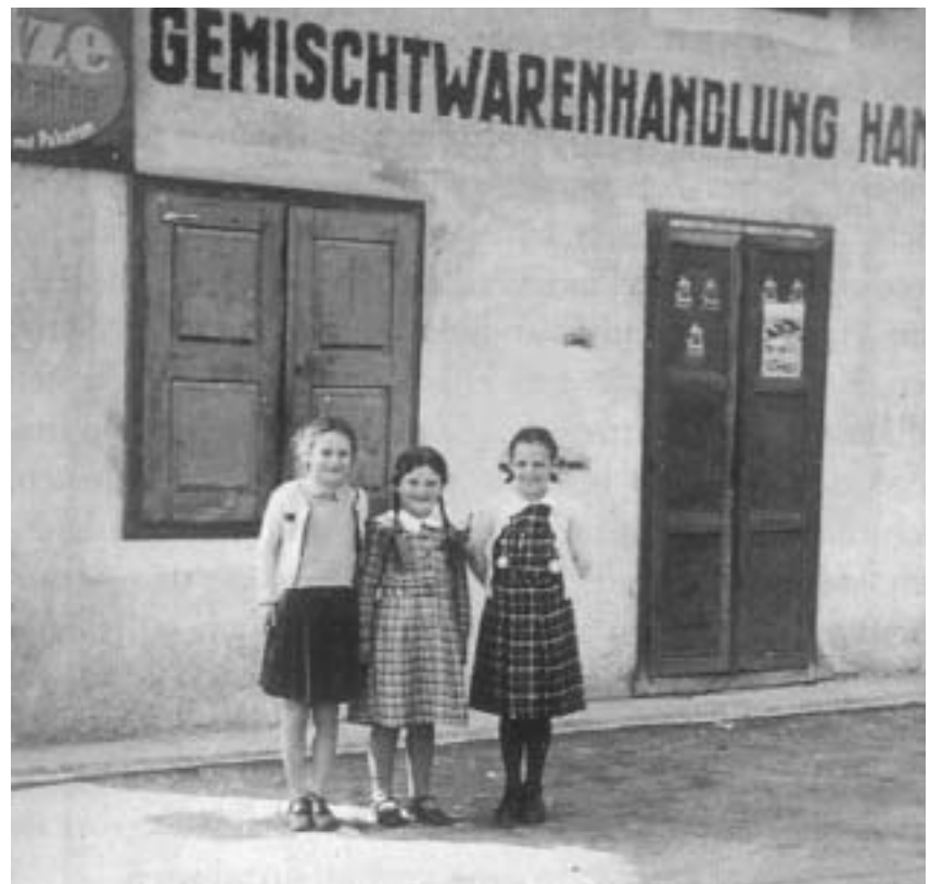
Gemischtwarenhandlung Neuhofer im Kragenrichterhaus (Markt 42) in den 1950er Jahren

Während in der Residenzstadt Salzburg die Kaufleute und Fernhändler die führende Schicht der Bürgerschaft bildeten, zählten die kleinen Kramer der Dörfer selten zum oberen Bereich der sozialen Skala und erlangten teilweise nie den Bürgerstatus. Das Führen eines solchen Kleinwarenhandels reichte nur in den seltensten Fällen zur Deckung des Lebensunterhalts und stellte vielmehr für viele Handwerker die Möglichkeit einer zusätzlichen Einnahmequelle dar. Die dörflichen Kramer hatten ein durchaus reichhaltiges Warenangebot aufzuweisen. So bot etwa Joseph Mayr in Seekirchen Ende des 18. Jahrhunderts neben den Gütern des täglichen Lebens auch Gewürze aller Art, darunter auch Anis und Safran, an. Neben den Kramern im Ortszentrum gab es noch eine große Zahl von Hausierern und Wanderhändlern, die ihre Waren den Käufern zudem „frei Haus“ lieferten. Jahrmärkte in Seekirchen boten immer wieder die Gelegenheit, sich mit dem Notwendigsten einzudecken, und auch die häufigen Märkte der Stadt Salzburg wurden von den Seekirchnern frequentiert. Die