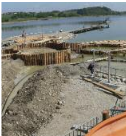
Wasserspaß im neu gestalteten Strandbad

Dieses wurde entfernt und durch einen kleinen „Teich“ mit Wellenbrechern ersetzt. Damit wird nun nicht nur ein angenehmeres Eintauchen in das Wasser gewährleistet, auch die Wasserqualität im Bereich der Rutsche wird nun eine bessere sein.