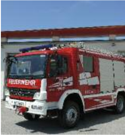
Das neue Rüstlöschfahrzeug-RLFA 2000

Nach 33 Einsatzjahren ist das alte Rüstlöschfahrzeug, welches normal für 25 Jahre konzipiert ist, in die Jahre gekommen. Auf Grund dessen hat die Stadtgemeinde Seekirchen nun das neue Rüstlöschfahrzeug-RLFA 2000 (A steht für Allrad, 2000 für 2000 Liter Wasser) angekauft.