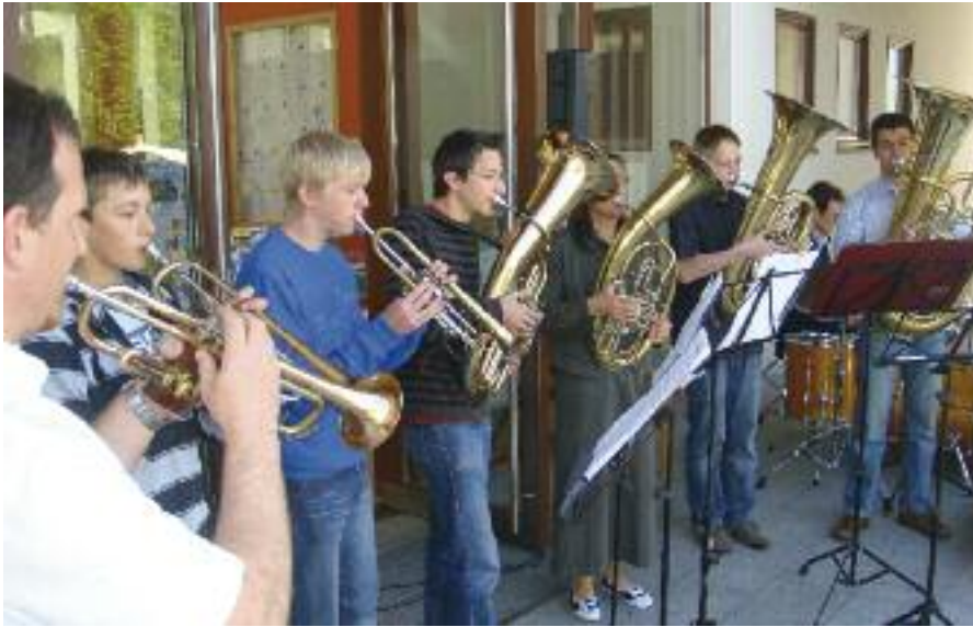
Am Samstag-Vormittag Musik vom Musikum Seekirchen

Mit Live-Musik, kleinen Aufmerksamkeiten, einem Gläschen Sekt und Muttertagsbasteln für das Geschenk „in letzter Minute“ wurde im Seekirchner Stadtzentrum der Muttertag gefeiert.