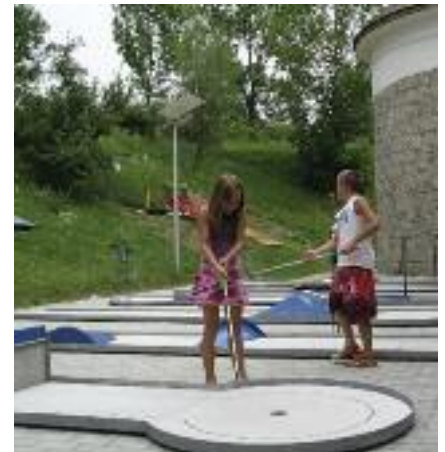
Der Minigolfplatz neben den Burgmauern

Auf dem Barfußweg kann man die Durchblutung der Füße durch unter-