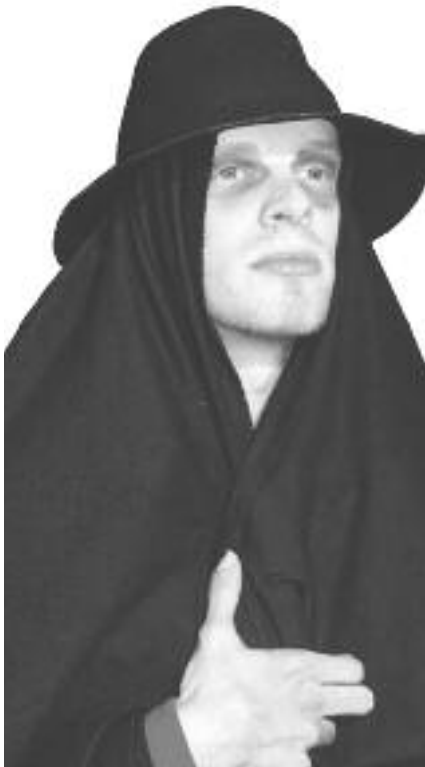
Eine Produktion im Rahmen der Aktion „Theaterwerkstatt Regie“ des Salzburger Amateurtheaterverbandes.