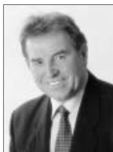
Bürgermeister Johann Spatzenegger