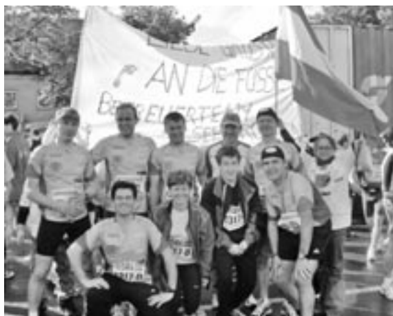
Gruppenfoto des Seekirchner Marathon Team

Wir konnten nicht nur das Hauptziel, die klassische Marathondis-