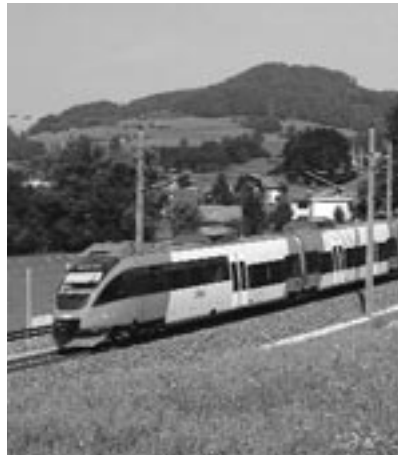
Salzburg Hbf in der Woche von 17.-22. September 2004.

Am Freitag, den 17. September werden im Stadtzentrum von Seekirchen „Schnuppertickets“ verteilt. Diese kostenlosen Schnuppertickets sind gültig für eine Hin- und Rückfahrt an einem Tag zwischen Seekirchen und