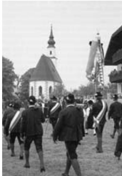
Kirchweihfest in Mühlberg 1986

Schließlich entschloss man sich aber aufgrund des geringen Stiftungsver-