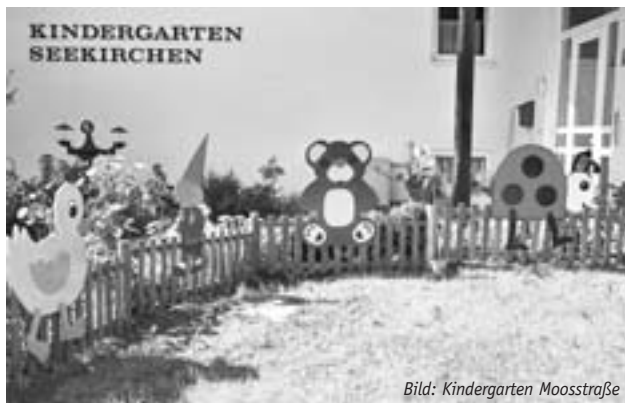
Bild: Kindergarten Moosstraße