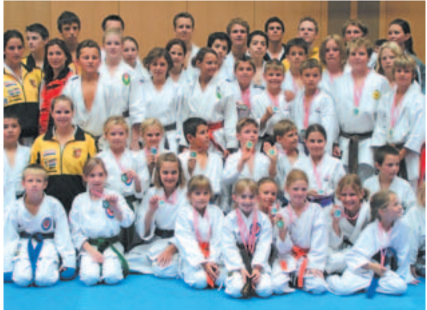
Die Salzburger Karatekas hoffen auf viele Medaillien

Hajime! Das ist japanisch und bedeutet kämpfe! Und das werden die KaratekämpferInnen am 18.3.2006 bei der Landesmeisterschaft in Seekirchen sehr oft hören. Rund 150 Starter erwartet der veranstaltende ASKÖ Karateclub Seekirchen in der Turnhalle des Gymnasiums Seekirchen. Beginn der Veranstaltung ist um 10 Uhr, gekämpft wird auf drei Kampfflächen gleichzeitig, die Finalkämpfe finden am späteren Nachmittag statt. Veranstalter Franz Scheubaumer verspricht sich und den Zuschauern den ganzen Tag über spannende Kämpfe. Für die richtige Einstimmung wird die Trommelgruppe „Trommeln For You“ und für das leibliche Wohl ein üppiges Buffet sorgen. Möglich ist die Durchführung dieser großen Veranstaltung durch die Mithilfe der Stadtgemeinde Seekirchen und vieler privater Sponsoren wie VPI Vermögensplanung, Spiel & Co Seekirchen, Budoland, Raiffeisen-