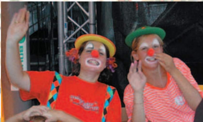
Spaß mit den Clowns für Groß und Klein

Auch in den öffentlichen Einrichtungen von Seekirchen wird der Fasching zünftig gefeiert. In der Stadtgemeinde übernehmen ab Mittag die „kranken Schwestern“ die Erstversorgung von durstigen Kehlen. Für die Kinder und Jugendlichen in den jeweiligen Schulen, Kindergärten und Horten organisieren die Betreuerinnen und Betreuer verschiedene Höhepunkte, wie zum Beispiel eine Kinderdisco, ein Faschingsgschnas oder ein Faschings-Café.