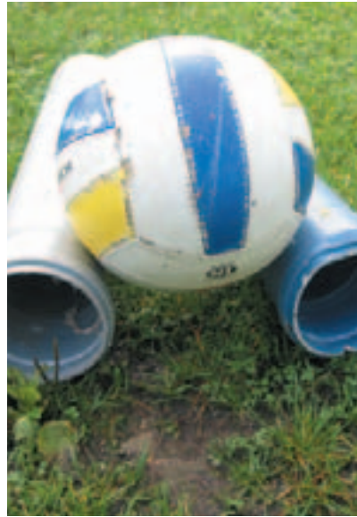
Dass diese Gegenstände im Kanal landen, ist unverständlich

Diese Zahlen sollen veranschaulichen, dass bei starken Regenereignissen sehr viel Oberflächenwasser in den Fäkalkanal gelangt, welches in weiterer Folge nicht nur hohe Pumpkosten verursacht, sondern auch zu erheblichen Schwierigkeiten führt und oft tiefer liegende Gebäudeteile überflutet.