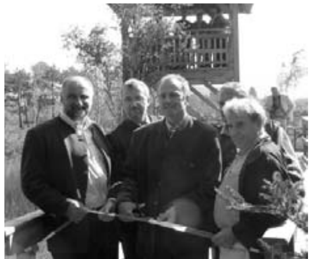
Eröffnung durch Landesrat Sepp Eisl