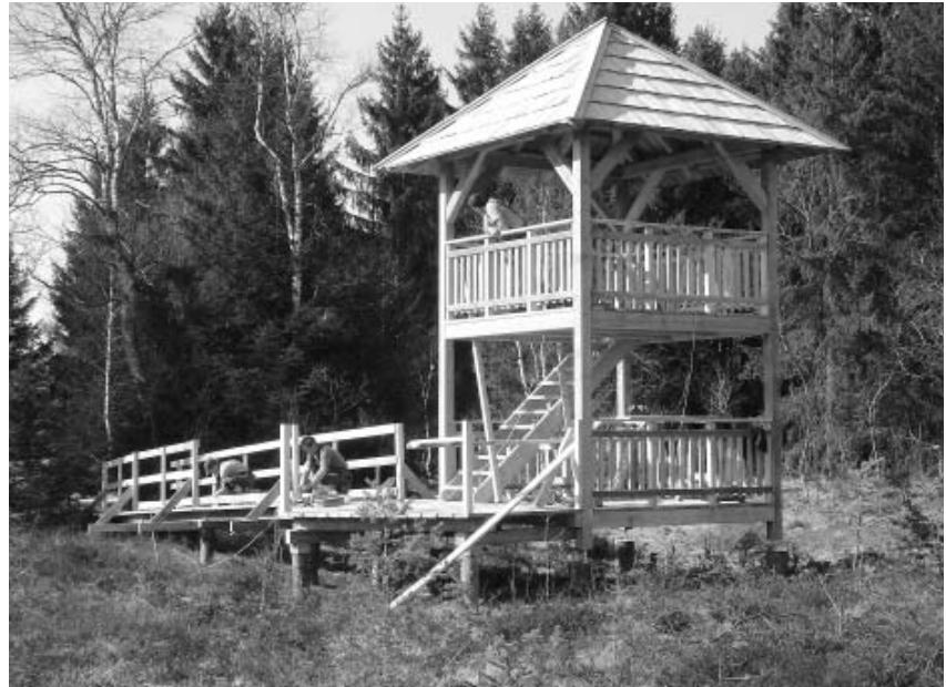
Aussichtsplattform vor der Fertigstellung

Seit 1999 wurden auf den 100 Hektar Projektflächen die Erstellung eines Landschaftspflege- und -managementplans, die Renaturierung des Wallerbachs, die Renaturierung des Eisbachs, die Wiedervernässung des Wenger Moors, ein Wiesenbrüterprojekt und Infomaßnahmen für die Besucher im Gebiet umgesetzt. Dies wird nun durch die Aussichtsplattform abgerundet, die den Wanderern und Spaziergängern einen einzigarti-