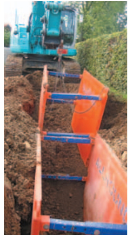
Oberflächenentwässerung beim Kindergarten in Henndorf

jahr, sowie das schlechte Wetter mit den vielen Regentagen verschiebt die Baufertigstellung unserer Kanalbauvorhaben weit nach hinten. Derzeit werden die Ortsteile Bruderstatt-Mitterstatt und Matschberg in Seekirchen sowie Hamberg und die Mehrzweckhalle in Henndorf an das öffentliche Kanalnetz angeschlossen. In Eugendorf wird zur Zeit ein Gebiet, in dem sich ein Mischkanal (Regenwasser und Fäkalwasser) befindet, mit großem Aufwand in ein Trennsystem umgebaut. Mit der