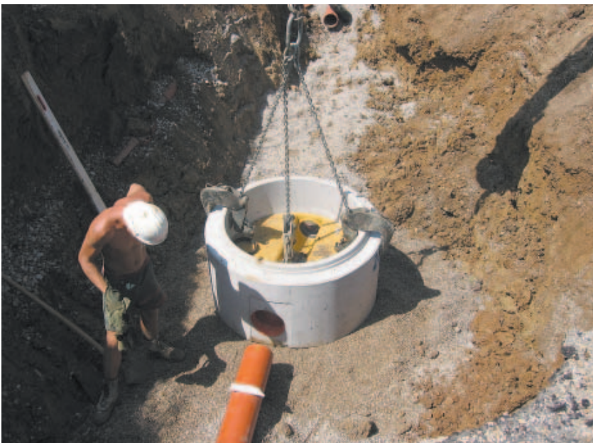
Kanalbaustelle in Matschberg-Seekirchen