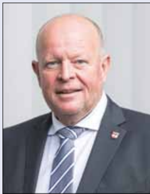
Bürgermeister Konrad Pieringer

Am 24. September 2000 fand die offizielle Feier zur Stadterhebung von Seekirchen statt. Wir werden das 20-jährige Jubiläum das ganze Jahr über begleiten. Start war die „61. Anton Wallner – Gedenkfeier“