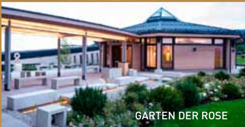
GARTEN DER ROSE