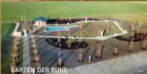
GARTEN DER RUHE