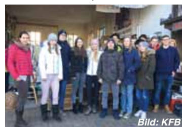
Besuch einer Klasse der HBLA Ursprung zum Thema Wiederverwenden.

2019 konnten so mehr als 400 Kinder sozialpädagogisch betreut werden, 1.000 Kinder eine gesunde Jause und 600 Kinder eine gute Schulbildung erhalten. Außerdem waren von den 76 Kindern, die 2019 die Grundschule abschlossen haben, zwei Drittel überdurchschnittlich gut im nationalen Vergleich. Mehr als ein Viertel der Kinder wird sich auf ein Stipendium für die Highschool bewerben können aufgrund ihrer guten Testergebnisse. Für Korogocho, wo die Chance darauf, eine weiterführende Schule zu besuchen, kaum vorhanden sind, ist das außerordentlich. Die Hope for Future Schulen geben durch die Unterstützung der Seekirchner Frauen und ihres Flohmarkts diesen Kindern in Nairobi nicht nur eine Hoffnung, sondern eine wirkliche Chance auf Zukunft.