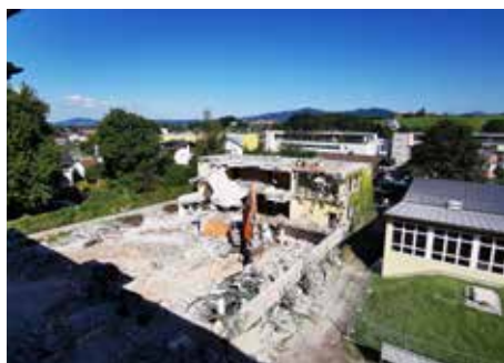
Die Abbrucharbeiten schreiten zügig voran

duktilen Pfähle zur Stabilisierung des neuen Gebäudes. Der dreigeschossige Neubau wird fünf Regelklassen mit Garderoben, Gymnastiksaal, Werkraum, Bibliothek, Sonderfachklassen und einen Lehrertrakt beinhalten. Die Fertigstellung ist für Juli 2026 geplant. Die Kosten belaufen sich auf rund Euro 18,6 Mio.