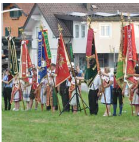
Die Fahnen werden geweiht

Insgesamt feierten mit der Seekirchner Feuerwehr 40 Gastabordnungen und über die drei Tage ca. 3.000 Gäste im Festzelt.