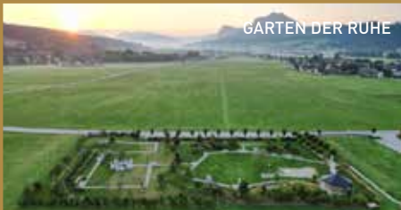
GARTEN DER RUHE