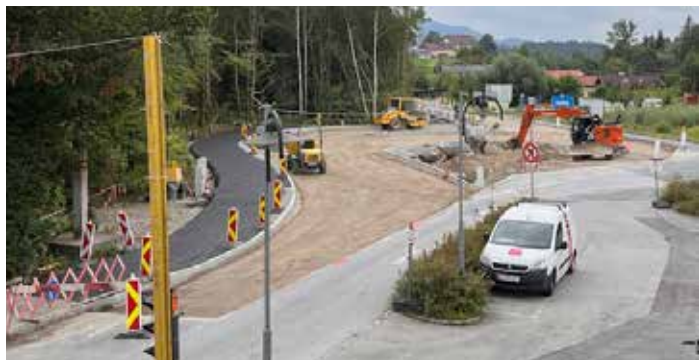
Die Kreuzung wird vom Land Salzburg neu gestaltet

Die Bauarbeiten des Landes Salzburg bei der Kreuzung Seekirchen Süd kommen gut voran. Wie schon berichtet, wird der Knotenpunkt mit der Salzburger Straße in südlicher Richtung verschoben, also in Richtung Mühlbergkurve, um eine deutliche Verbesserung der Kreuzung zu erzielen. Im Zuge der Arbeiten werden auch Linksabbieger, von Obertrum kommend als auch von Eugendorf kommend, vorgesehen. Des Weiteren wird der bestehende östlich gelegene Geh- und Radweg im Kreuzungsbereich zur Fischachbrücke neu geführt und die bestehende Bushaltestelle „Mühlbergsiedlung“ mittels neuem westlichen Gehsteig und einer Querungshilfe erschlossen. Die Bauarbeiten sollen Ende September abgeschlossen sein.