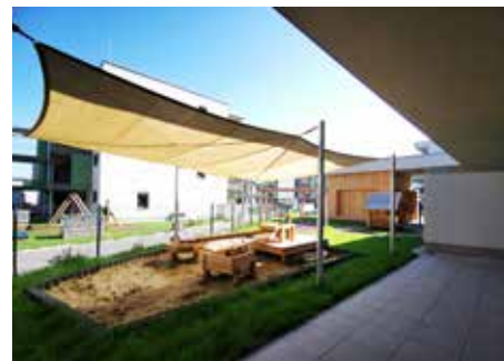
Spielplatz Kleinkindgruppen

Der Kindergarten Stiftsgasse ist mittlerweile 30 Jahre alt. Im Laufe dieser Zeit haben der Holz-Fassade die Witterung, Unwetter und Hagel zugesetzt. Im Juli wurde diese nun um ca. Euro 10.000 saniert.