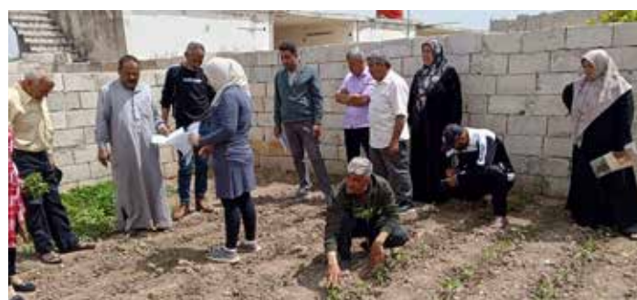
Weil gegen Hunger nachhaltig ein Kraut wachsen kann.