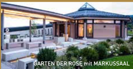
GARTEN DER ROSE mit MARKUSSAAL