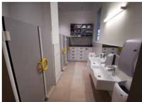
Moderne Sanitärräume

Euro 3,1 Mio. für den Kauf der Liegenschaft und knapp Euro 430.000 für die Innen- und Außeneinrichtung. Am Dach des Gebäudes Windhagerstraße 27 wurde eine 60 kWp-Anlage um Euro 120.000 errichtet. Somit hat die Stadtgemeinde Photovoltaikanlagen auf gemeindeeigenen Gebäuden mit einer Gesamtkapazität von 366 kWp.