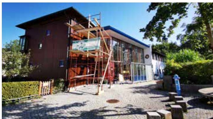
Fassadensanierung KiGa Stiftsgasse

Die Sanitärräume von drei Gruppenräumen im Kindergarten Moosstraße sind noch aus den 70er Jahren. Den Sommer über wurden diese nun komplett saniert und auf den Stand der Zeit gebracht. Auch die Parkettböden der Gruppenräume im Kindergarten wurden geschliffen. Aus diesem Anlass findet der Sommerkinder heuer im neuen Kindergarten in der Windhagerstraße 27 statt. Dabei entstehen Kosten von rund Euro 95.000.