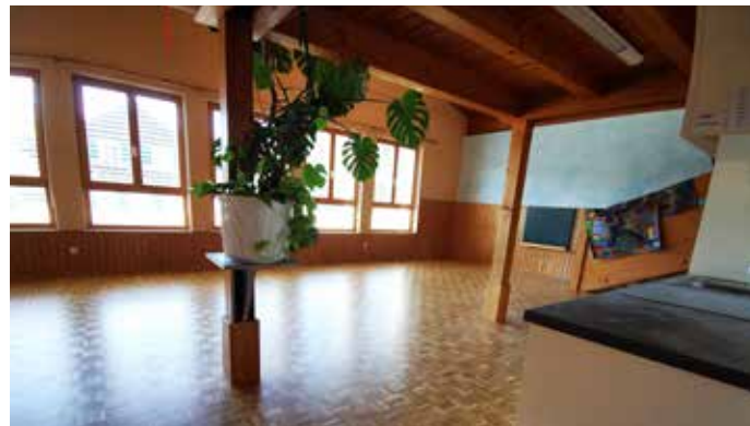
Der Boden wurde abgeschliffen

Die Arbeiten bei der Mittelschule schreiten zügig voran. Ende Juli war das rückwärtige Gebäude aus dem Jahr 1976, das in Stahlbeton und Holzbauweise neu errichtet wird, schon abgetragen. Bis Mitte August werden die Baurestmassen abtransportiert sein. Dann erfolgen die Kernbohrungen für die