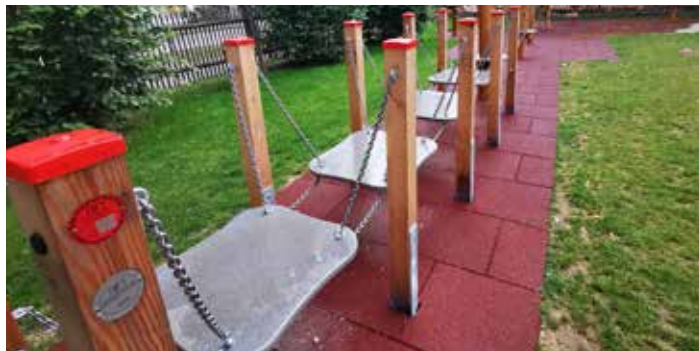
Neue Spielgeräte für die Kleinen

Der Rupertspielplatz wurde mit neuen Spielgeräten ausgestattet und die bestehenden wurden geprüft und wenn nötig instand gesetzt. Die Kosten beliefen sich dafür in Summe auf Euro 95.000.