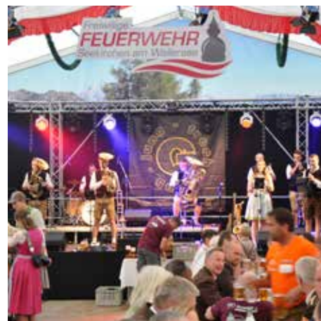
Für Stimmung war im Festzelt gesorgt