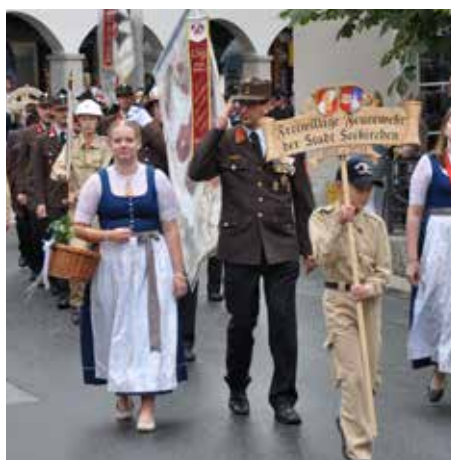
Der feierliche Festzug