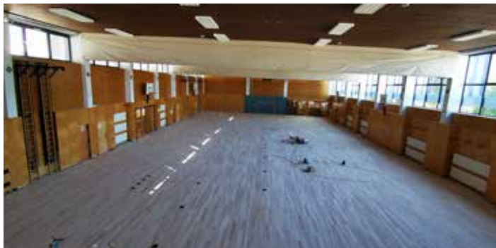
Der Boden wurde saniert

Durch die intensive Nutzung durch Schule und Vereine war der Boden in der Mehrzweckhalle sanierungsbedürftig. Nach 25 Jahren wurde er abgeschliffen, saniert und erstrahlt nun in neuem Glanz. Dafür wurden Euro 67.000 investiert.