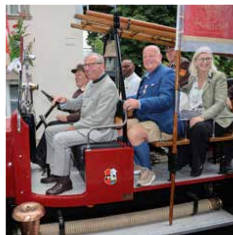
LH Haslauer, Bgm. Pieringer und Bezirkshauptfrau Gföllner