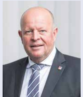
Bürgermeister Konrad Pieringer

Radfahrer und Fußgänger können durch den Personendurchgang unter den Gleisen diese unterirdisch gefahrlos queren. Im Frühjahr 2025 wird noch eine öffentliche Toilette errichtet. Digitale Info-Terminals werden über die aktuellen Fahrpläne und Veranstaltungen im Stadtgebiet informieren. Am 25. April 2025 findet die feierliche Eröffnung des neuen Bahnhofs statt.