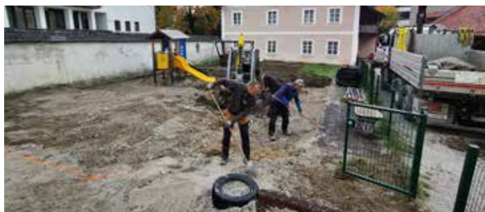
Der neue Spielplatz wächst