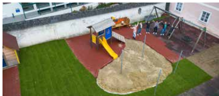
Der neue Spielplatz ist fertig