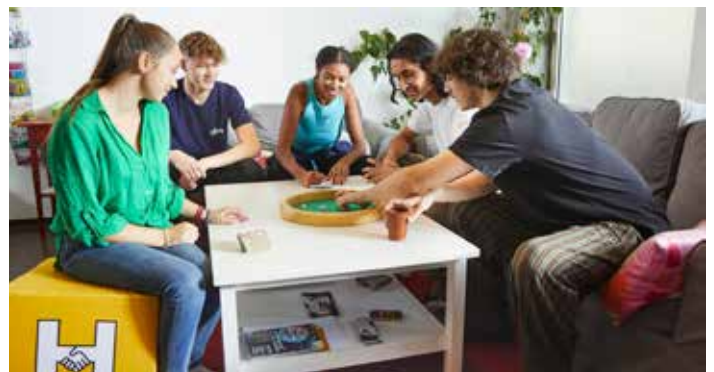
Derzeit werden im Bundesland Salzburg 13 Jugendtreffs und Jugendzentren vom Hilfswerk Salzburg geführt, darunter das timeout Seekirchen.

Die Öffnungszeiten des timeout Seekirchen sind Montag von 13:30–19:30 Uhr und Mittwoch bis Freitag von 13:30–20:30 Uhr . Kommt vorbei, wir freuen uns auf euch!