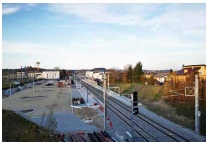
P&R Parkplatz vor Asphaltierung mit Bahnhof im Hintergrund

Mit dem jährlichen Fahrplanwechsel Mitte Dezember gibt es heuer einen wesentlichen Qualitätssprung im Seekirchner Öffi-Netz. Als Ergänzung zu den bestehenden Bahnhöfen und Haltestellen der Region steht die neue Bahn-Haltestelle Seekirchen Stadt ab Sonntag, 15. Dezember 2024 allen Fahrgästen zur Verfügung. Ab diesem Zeitpunkt halten die Züge fahrplanmäßig in der neuen Station. Die neue Haltestelle Seekirchen Stadt befindet sich im Bereich zwischen dem ehemaligen Bahnübergang Anton-Windhager-Straße und dem Umspannwerk der Salzburg AG. Ein Personendurchgang und zwei Lifte ermöglichen den barrierefreien Zugang zu den Bahnsteigen. Radfahrer:innen können die Verbindung unter den Gleisen, die über zwei Rampen erreichbar ist, ebenfalls nutzen. Gemeinsam mit einer neuen Bushaltestelle, finanziert durch die Projektpartner Stadtgemeinde Seekirchen, Land Salzburg und ÖBB-Infrastruktur AG, werden die Voraussetzungen geschaffen, die Bahnstation und den neuen Stadtteil rund um Bezirkshauptmannschaft und Gericht optimal ans öffentliche Verkehrsnetz anzubinden.