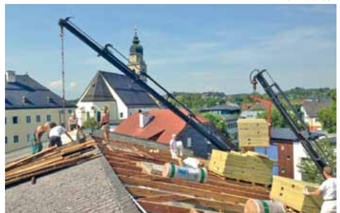
Das Dach der Volksschule wurde saniert und gedämmt.