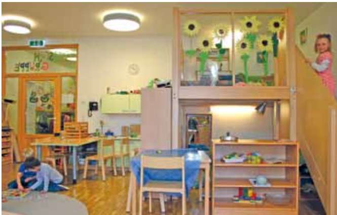
Der Kindergarten Moosstraße wurde saniert und attraktiv erweitert.