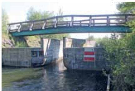
Hochwasserschäden an der Klauswehr.

Übrigens sind 2013 fast 4.000 Schleusenfahrten von den rund 200 Schleusenkartenbesitzern registriert worden, die mit ihrem Jahresbeitrag diese Arbeiten mitfinanzieren. Die oftmaligen technischen Kontrollen der mechanischen Anlagen des Seekirchner Hochwasserschutzes haben sich beim Hochwasser 2013 bezahlt gemacht – die Anlagen funktionierten auch bei diesem Extremereignis einwandfrei. Die Reparatur der Hochwasserschäden an der Klauswehr