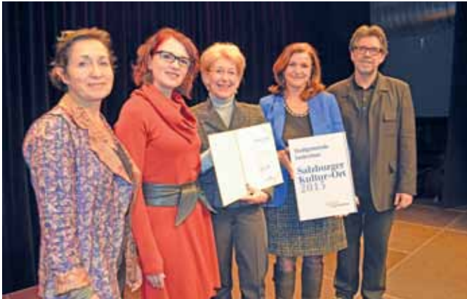
Der Verein Kunstbox erhält einen Förderpreis von €50.000,- und Seekirchen war „KulturOrt 2013“.