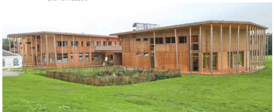
Im September wurde die Sonneninsel eröffnet.