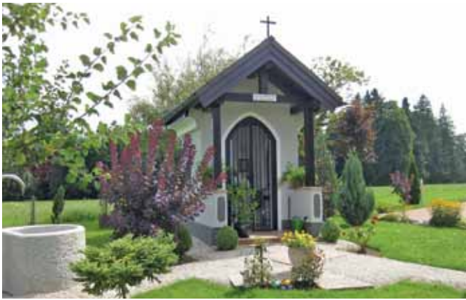
Mit dem Projekt Kirchen und Kapellen wurde die Bedeutung dieser Kleinode festgehalten.