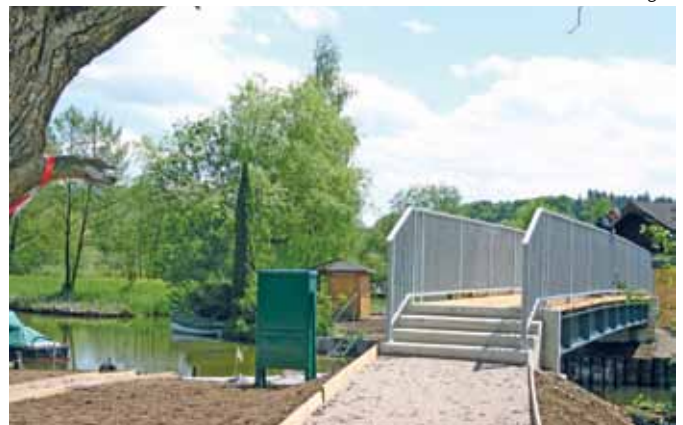
Der Kapellersteg wurde neu errichtet.