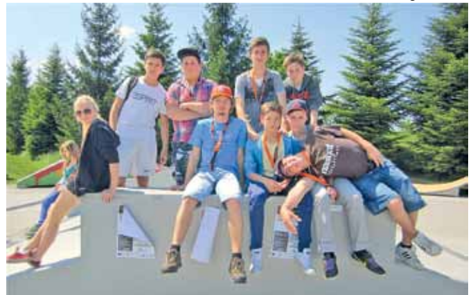
Die Erweiterung des Skateparks freut die Jugendlichen.