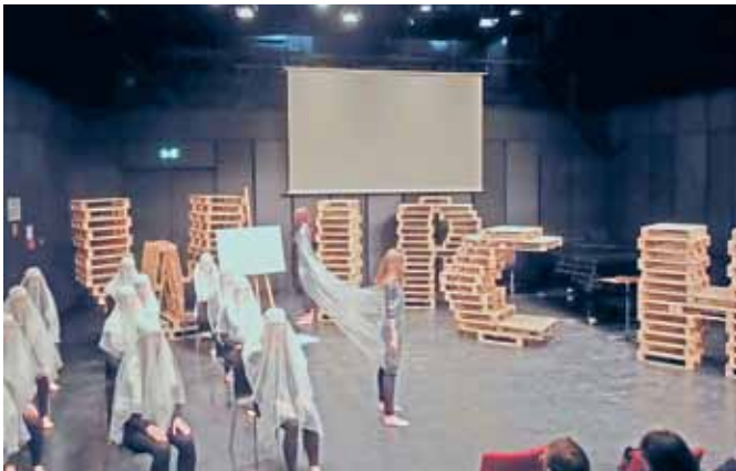
Die Volksschule Mödlham fördert die Kreativität der SchülerInnen und wurde mit einem Preis ausgezeichnet.