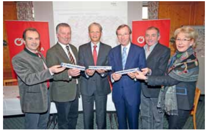
Die HL-Strecke wird Seekirchen nur unterirdisch queren.