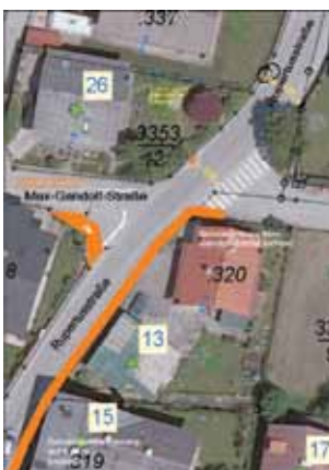
Die Rupertsstraße ist nun verkehrsberuhigt.