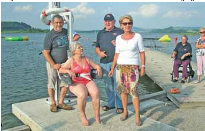
Eine große Erleichterung ist für viele der behindertengerechte Badelift.