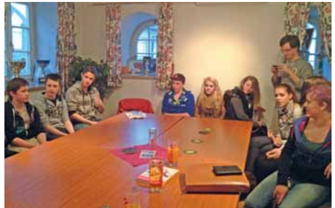
Große Beliebtheit erfreut der regelmäßige Jugendstammtisch.