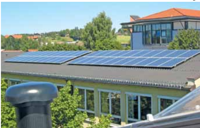
Mit der Errichtung von Photovoltaikanlagen und anderen energiesparenden Maßnahmen erreichte Seekirchen bei e5 bereits 3e's.