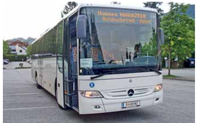
Seit Dezember gibt es einen Stadtbus - Linie 125 - vom Zentrum nach Mödlham.