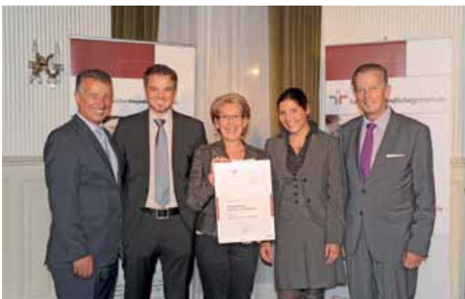
Seekirchen erhielt das Zertifikat „familienfreundlicheGemeinde“.