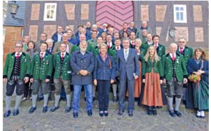
Das 45jährige Jubiläum der Städtepartnerschaft mit Frankenberg wurde gefeiert.