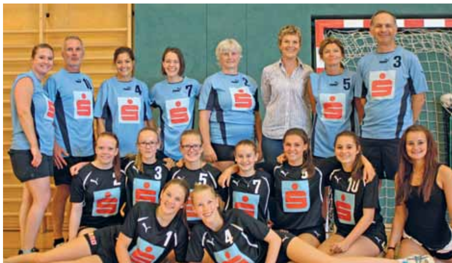
Ein Lehrerteam der Sport-NMS war chancenlos gegen die Mädchen der Schülerliga-Volleyballmannschaft.

Am Freitag, 28. Juni 2014, wurden im Rahmen einer Feier SchülerInnen der Sport-NMS Seekirchen für außergewöhnliche Leistungen geehrt.