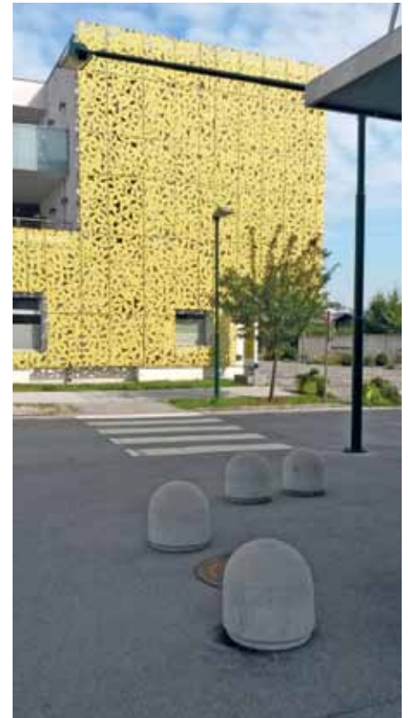
Schutzweg mit Beleuchtung.