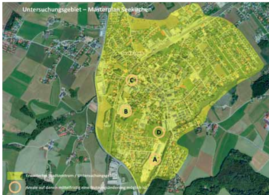
Planungsgebiet für ISEK.

Die Stadtgemeinde Seekirchen hat in ihrer Sitzung vom 25. September einen Grundsatzbeschluss zur mittel- und langfristigen Umsetzung der vorgeschlagenen Grundsätze und Ziele beschlossen.